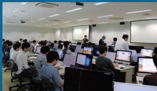
スパコンTSUBAMEを使った演習授業