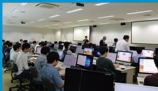
スパコンTSUBAMEを使った演習授業